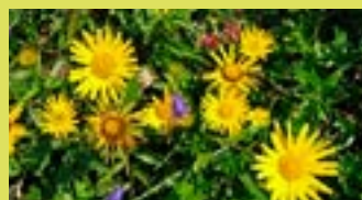
Großes Flohkraut Ochsenauge